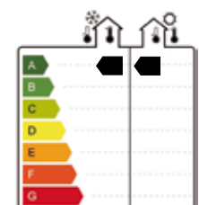
Effizienzklasse für winterlichen Wärmeschutz (links) und sommerlichen Wärmeschutz (rechts) für Zenit 76. 4)