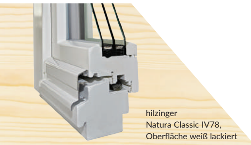
hilzinger Natura Classic IV78, Oberfläche weiß lackiert

hilzinger Holzfenster sind wie ein Möbelstück sehr hochwertig verarbeitet. Zur Auswahl stehen die Holzarten Fichte, Kiefer, Meranti, Sibirische Lärche und Eiche in 78 und 92 mm Bautiefe. Während die Standardlösung Natura Classic mit Aluminiumregenschutzschiene sowohl im Neubau als auch in der Modernisierung zur Ausführung kommt, sind die Varianten (siehe Rückseite) Stil, Denkmal und Altbau spezielle Modernisierungslösungen, wenn es um eine stilgetreue Nachbildung von Fenstern geht.