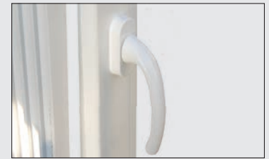
RAL geprüfter Fenstergriff

Sie befinden sich an allen wichtigen Positionen rund um das Fenster. Der Anpressdruck ist regulierbar und kann optimiert werden. Das Fenster schließt dadurch sehr komfortabel. Lärm, Kälte und Schlagregen bleiben draußen.