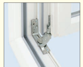
Ansicht des unteren Ecklagers