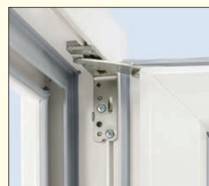
Ansicht des oberen Scherenlagers